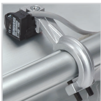
Możliwość montowania czujników DH za pomocą uchwytów