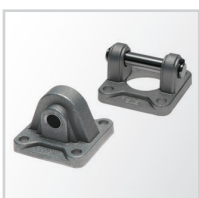
Elementy montażowe oryginal UNIVER