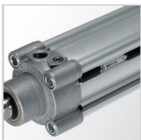
Korytka montażowe czujników dostępne w różnych pozycjach