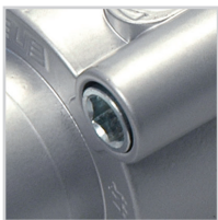
Śruby mocujące zintegrowane z profilem pokryw