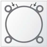
Profil tulei z korytkami montażowymi czujników oryginal UNIVER od 2005