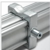
Jarżmo nastawne z systemem montażowym konstrukcji UNIVER zaaprobatowanym w sektorze AUTOMOTIVE