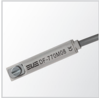
Czujnik położenia tłoka seria DF