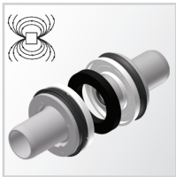
Standardowy tłok z wkładką magnetyczną